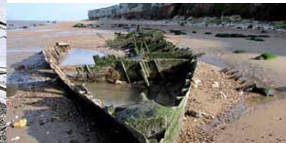
Wrak van de Sheraton, Hunstanton UK