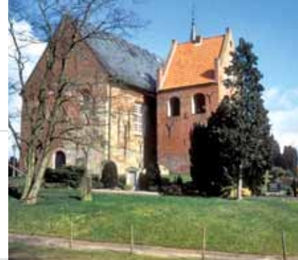
Wierde met kerk in Zetel, Niedersachsen

de belangrijkste inkomstenbronnen geworden. De keerzijde hiervan is dat bouwprojecten zoals nieuwe hotelcomplexen en tweede huizen een aanzienlijk effect hebben op het landschap. Daarom is informatie over culturele en landschappelijke waarden van een regio belangrijk voor de toeristische sector. Dit kan worden gebruikt voor de marketing of geïntegreerd in nieuwe bouwprojecten, die op deze wijze meer aansluiten bij het lokale landschap. Kustbescherming en waterbeheer spelen sinds de middeleeuwen een sleutelrol in de vormgeving van het landschap. De aanleg van zeedijken en kanalen is het werk van deze sector. In het licht van de opwarming van de aarde zijn maatregelen ter bescherming van de kust van steeds groter belang. Voorgesteld wordt om bij deze maatregelen rekening te houden met de cultuurschatten. Geïntegreerd beheer van kustgebieden (ICZM) is in deze context van wezenlijk belang.