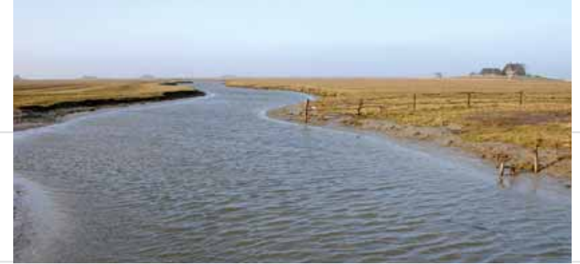
Hallig Hooge, Schleswig-Holstein; © Archäologisches Landesamt SH

ste is. Uitgestrekte veengebieden, zoals het Teufelsmoor in het achterland van Land Hadeln, werden pas aan het begin van de moderne tijd gekoloniseerd en drooggelegd, waardoor echte dorpen ontstonden. Het eiland Norderney had aan het einde van de 18de eeuw het eerste kuuroord aan de kust. De kuurfaciliteiten en toeristenhotels zijn tot op de dag van vandaag bepalend voor dit populaire eiland.