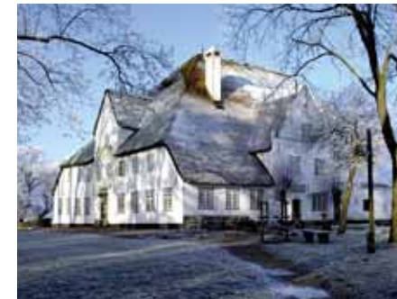
„Roter Haubarg“ in Eiderstedt, Schleswig-Holstein; © Archäologisches Landesamt SH

Het Nederlandse Westergo, in het hart van Friesland, bezit niet alleen enkele van de oudste terpen, maar ook de oudste zeedijken in het Waddengebied; de meeste werden rond 1000 na Chr. aangelegd. De omringende kweldergronden zijn doorweven met een netwerk van sloten en kanalen, die vaak hun oorsprong vinden in voormalige getijdenstromen. Het waren de verkeerswegen van de middeleeu-