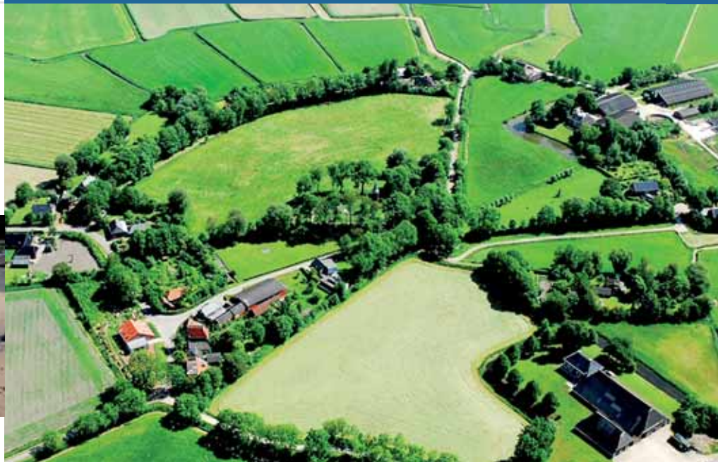
Terp dorp Toornwerd bij Middelstum, Nederland; © Jan Heuff

HAUKE JÖNS : Hoofd van de afdeling Cultuur- wetenschappen, Niedersächsisches Institut für Historisch Küstenerforschung