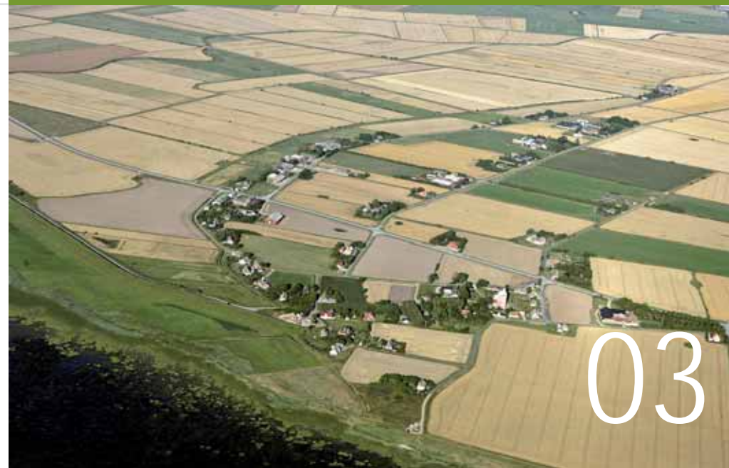
Ballum Vesterende, Denemarken; © Svend Tougaard