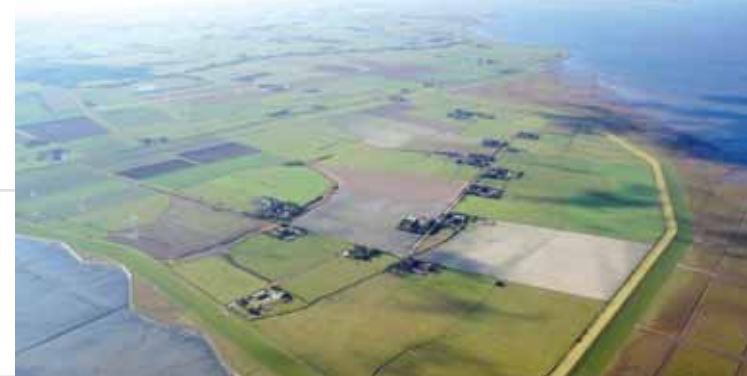
Buphever Koog op Pellworm, Schleswig-Holstein; © Archäologisches Landesamt SH

In ieder land zijn regelmatig bijeenkomsten gehouden met belanghebbenden, waar het project en zijn doelstellingen en activiteiten wer-