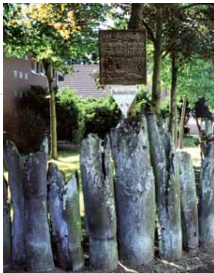
Traditioneel hekwerk van walvisbotten op Borkum, Niedersachsen