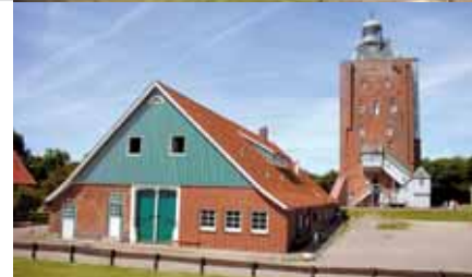
Verdedigingstoren op Neuwerk, Waddenzee boven Hamburg