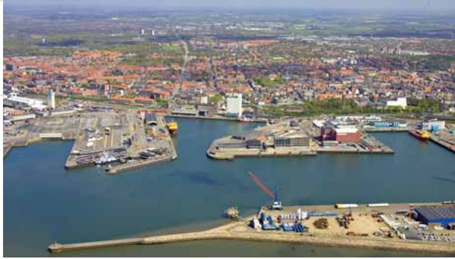
Blik op Esbjerg en de haven, Denemarken

rivier de Varde Å slingert door kweldergronden in de buurt van Esbjerg en stroomt in zee als de enige rivier zonder beschermde monding. De geschiedenis van Ribe als handelspost gaat terug tot de Vikingtijd, waardoor deze plaats de oudste plaats langs de Waddenzeekust is. De Waddenzee in Noord-Friesland en het meer zuidelijk gelegen Sleeswijk-Holstein is bezaaid met kleine eilanden. De jongste eilanden worden Halligen genoemd en zijn pas in de afgelopen eeuwen ontstaan. De bewoners van deze eilanden moeten nog steeds op terpen wonen om zich te beschermen tegen de regelmatig terugkerende overstromingen in de winter.