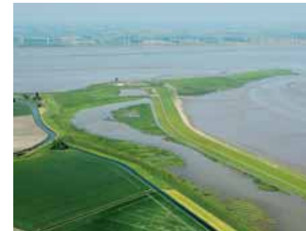
Punt van Reide, Eems, Nederland

wen en van het begin van de moderne tijd. Hoewel The Wash in Oost-Engeland geen deel uitmaakt van het Waddengebied zelf, vertoont het opvallende overeenkomsten in landschap en geschiedenis. Ook hier worden uitgestrekte wadden en kwelders doorsneden door getijdenkreken. Ook hier hebben de mensen zich sinds de middeleeuwen met zeedijken beschermd tegen de dreiging van de zee. En toch geven de middeleeuwse steden en dorpen en de Normandische kastelen, die in een halve cirkel uitkijken over de baai, The Wash een geheel ander eigen karakter.