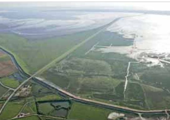
Het eiland Rømø, Denemarken