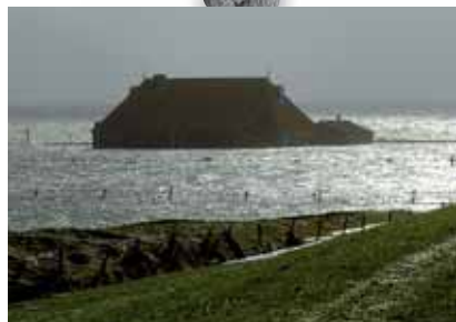
Wierschuur op Terschelling, Nederland; © Jan Heuff