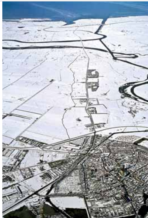
Ribe uit de lucht, Denemarken

De bewoners van het gebied langs de Waddenzee hebben het landschap in belangrijke mate gevormd. Dit landschap maakt deel uit van de lokale identiteit en is een waardevol bezit voor de toekomst. Het internationale project LancewadPlan, richt zich op de duurzame bescherming van het unieke landschapelijke – en cultuurhistorische erfgoed in dit gebied en hun integratie in een voorspoedige economische ontwikkeling. Het project werd meegefinancierd door het „Interreg IIB Noordzeeprogramma“ van de EU. Deze brochure geeft informatie over de achtergrond, doelstelling, inhoud en resultaten van dit project.